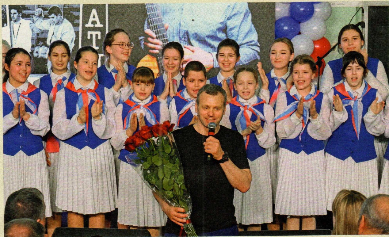
Камерный хор Ансамбля имени Локтева. Всемирно известный Ансамбль создан в 1937 году по инициативе А.В. Александрова (автора гимна СССР). Сегодня в репертуаре имеет несколько песен И.И. Куринного